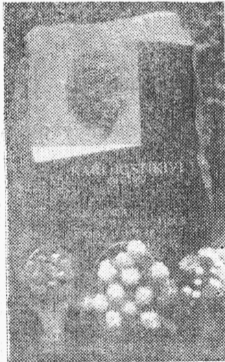
16. oktoobril 1987 avati Varblas kirjaniku mälestus-samm.

K. Ristikivil on ilmunud ka novellikogu «Sigtuna väravad», luulekogu «Inimese teekond» ning publitsistikat.