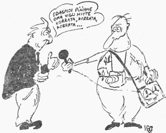
Joonistanud INDREK PRODEL

«TALLINNA POLÜTEHNIKU» TOIMETUS SOOVIB KÕIGILE KAASAUTOREILE JA LEHELUGEJAILE EDUKAT UUT AASTAT, VABANDAB MÖÖDUNUD AASTAL LEHTEDESSE EKSINUD VIGADE PÄRAST NING LUBAB NEID UUEL AASTAL MITTE KORRATA.