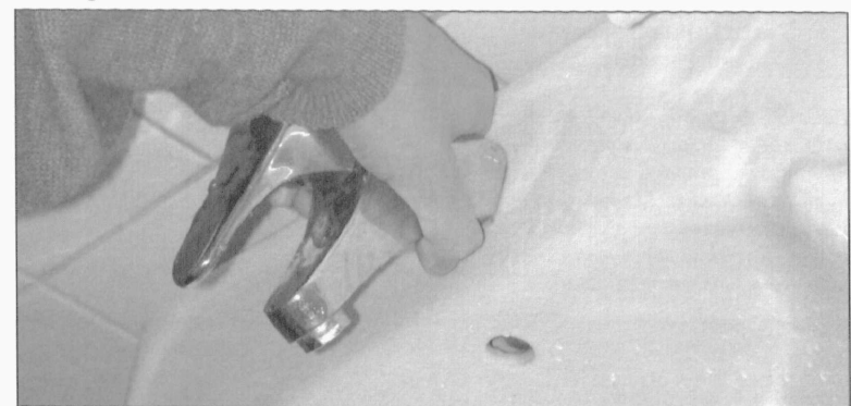
PROBLEEM: Praegustes viletsates ühiselamutingimustes ei oska tudengid ühismandit hinnata.