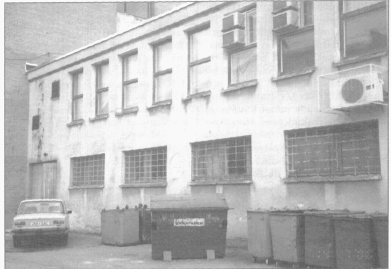
KÜSIMUS: Kus asuvad pildidel kujutatud õuduste unenäod?

Mustamäel on ülikoolil (va ühiselamud) üle 50 tuhande m 2 , millest umbes 30% on üldkasutatavaid pindu (trepikojad, koridorid) ning umbes 50% on seotud meie jaoks põhitegevusega. Sellesse rühma kuuluvad nii auditooriumid, erinevad laborid kui ka õppejõudude ning administratsiooni tööruumid. Inventariseerimise käigus kaardistati üle 1300