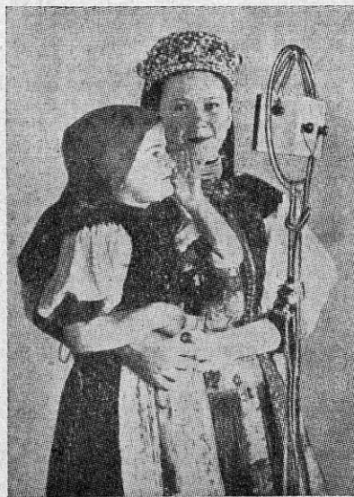
Kaks rahvariides neidu Budapesti mikrofoni ees tervitamas oma sõpru.

Elu provintsilinnades erineb tervalt pealinn Budapesti omast. Kuulus oma lõbustusparkide, vanade mälestusmärkide, tervisvee-allikate ja Doo-