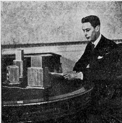
Inglise kuningas George VI

Itaalia on hoogsalt radiofitseerimas Abessiinat. Addis Abebas on avalikele platsidele üles seatud võimsad valjuhääldajad, mille abil levitatakse uudiseid ja muusikat. Need valjuhääldajad asendavad kogu idamaal tuntud „lugude-jutustajaid“, mis tuulekiirul levitavad uudiseid linnast linna ja maalt maale. Seega tehakse hüpe üle terve arenguastme: abessiinlased hakkavad pärast suulist edasiandmist uudiseid saama kohe ringhäälingu teel, kusjuures jääb vahele vahepealne aste, ajaleht. Vahest tuleb see kunagi tagantjärele.