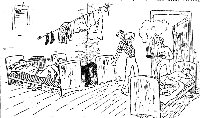
Laia tänava ühiselamu tuba nr. 10