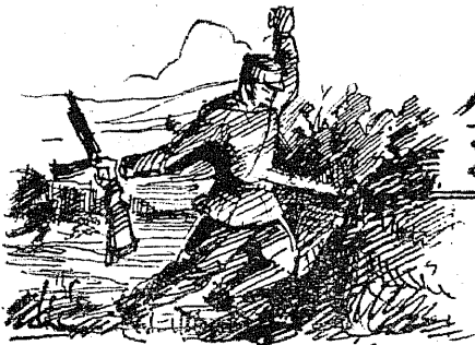
Ris. B. Писка

Сопка тает в тумане... В утренней синей мгле ветер шуршит гаюляном. Клинит стелби к земле. Ветер кружит, срывая блёквые листья кимчи. Реже ракеты взлетают. Враг окопался.