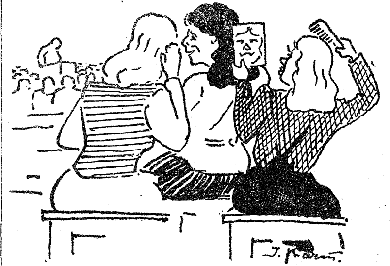
I. Karmi karikatuur