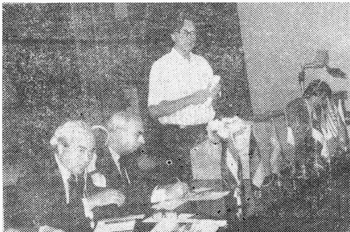
Hr. Sparring Rootsist rääkis rahvusvahelisest poliitikast.

G. LAPIDUS (Ameerika Ühendriigid) teemal: «Etnilise poliitika teoreetilised ja võrdlevad perspektiivid.»