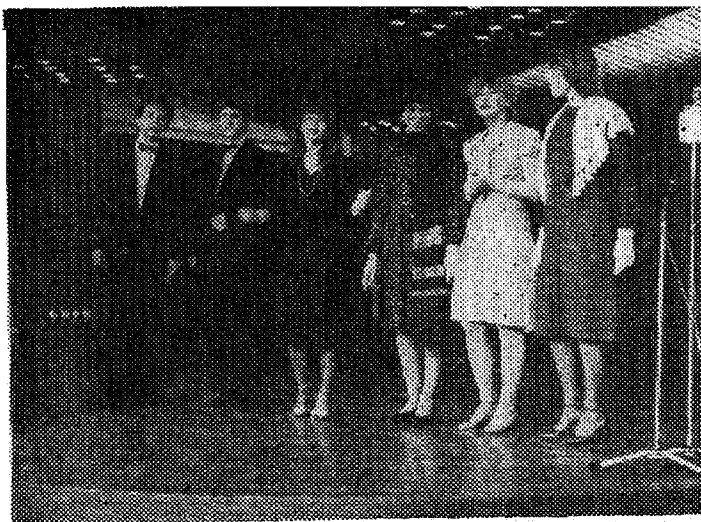
Keemiateaduskonna rebased esinemisjulguses.

Oli instituudi taidluskonkurs. Etteasteid kahe päeva peale kokku üheksa, Vähevoitu. Laureaatideks tunnustati ehitusteaduskonna duo ja imepärane «joga», majandusteaduskonna trio, keemiateaduskonna näite-trupp ja kandlemängija, ehitus-, mehaanika- ja automaati-kateaduskonna ühendžässbänd. Kõigi nende esinemist on võimalik näha veel 16. aprillil J. Tombi nim. Kultuuripalees (RSP raames) ja loomulikult ka vabariiklikul konkursil.