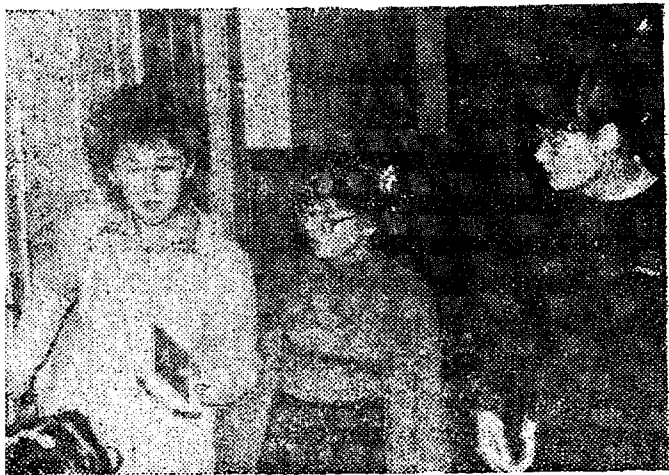
«Конечно, пятерка! Знай наших!»