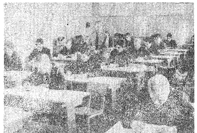
На военной кафедре. Занятия по технической подготовке.