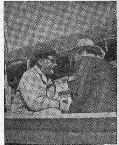
Rootsi ringhäälingu reporter kalurit usutemas.

Rootsi tööstusel on hea nimi kogu maailmas tema toodete kõrge väärtuse tõttu. Eriti kuulsad on Rootsi metsa- ja terasesaadused, rootsi tikud ja elektritarbed. Kuid arvatavasti keele-