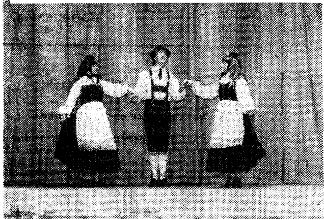
«Tere, fibukene, kabujalakene...»

satas nii mõnegi peas mõte kiiresti mõddalennanud kahest tunit. Peale kontserti tegi meie ansambel ka tantsumuusikat. Sõitsime ööbimiskohta, spordihoonesse. Ees ootaid mõnusad tinnid saunas ja ujumisbasseinis. Saunamõnu vahetas esinemisvõlu vääriiselt välja. Järgmisel päeval sõitsime Sondasse. Jällegi kontsert. Ka siin võeti meid hästi vastu. Lubasime Sondasse tagasi minna suvel, sealsete rahvakunstipeole. Loodame, et kontserdid jäid rahvale sama hästi meelde, kui meile nendepoolne siiras vastuvõtt.