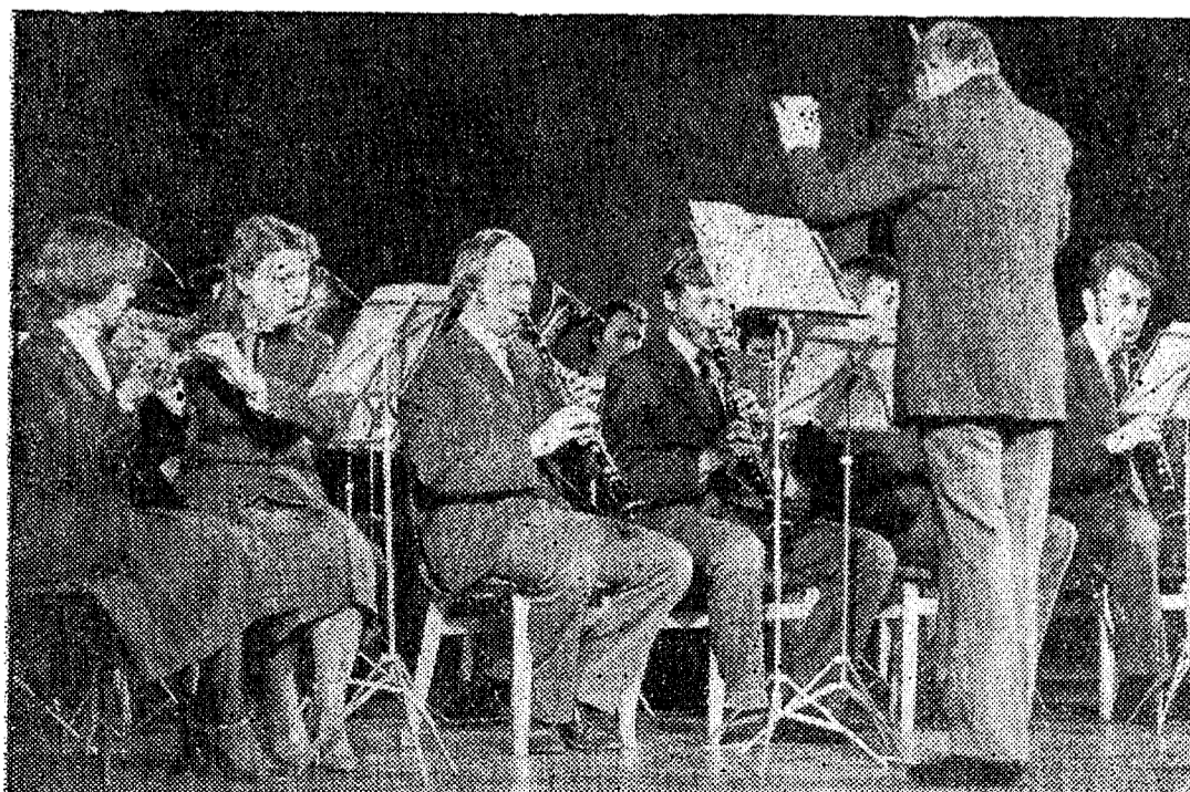
● Mängib meie puhkpilliorkester, üliõpilaste vabariikliku taidluskonkursi laureaat.