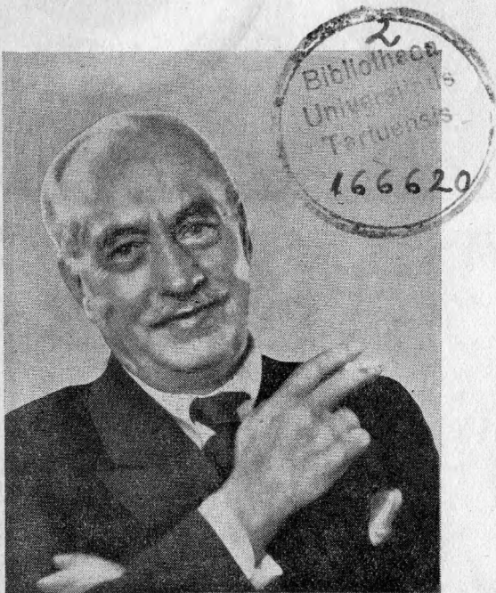
PAUL LINCKE 70-AASTANE

Vahepeal on päevakorrale kerkinud tehnika-muuseumi asutamine. Või tuleks ehk seal ette näha raadio osakond? Igatahes peaksid Riigi Ringhääling ja Eesti Raadioühing hoolitsema, et raadiomuuseumi küsimus saaks kägu. —ste.