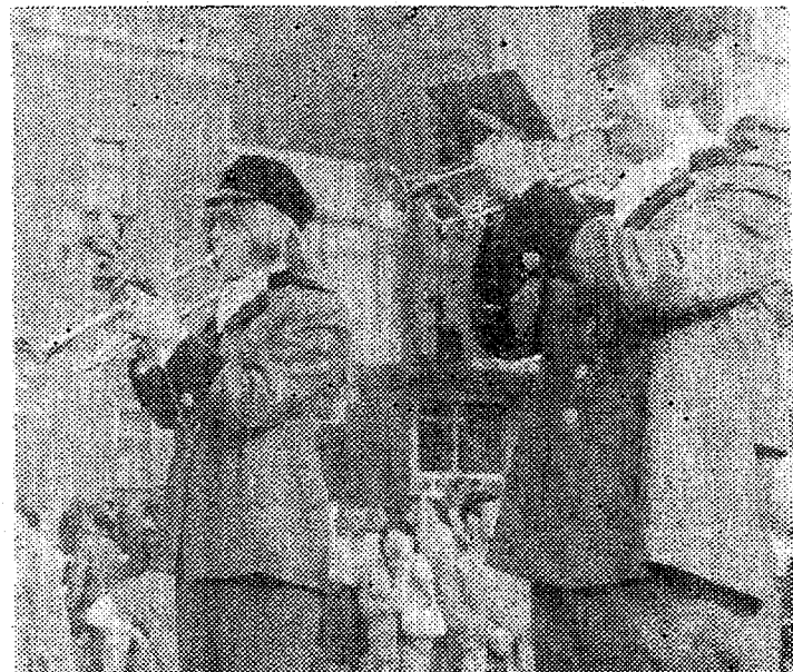
● Paraadmundris puhkpilliorkester.

Lisagem veel, et veebruaris esineb Tallinnas RPI akadeemiline meeskoor «Gaudamus», väga tugev kollektiiv RPI tant suansambli «Vektors» kõrval — mõlemad seni kõiki üliõpilas laulupidusid ilmestanud.