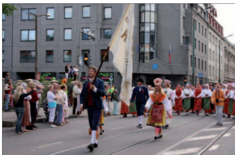
TTÜ rahvatantsuansambel Kuljus laulu- ja tantsupeo rongkäigus

Soov osaleda laulupeol tõi ühe seltskonna tegijaid taas kokku – kammerkoori vilistlased löid oma koori. Laulupeol olid nad meie kolonnis ja praegugi harjutavad ülikooli ruumides. Mõõdunud sügis tõi kokku veel ühe noortekollektiivi Big-Bandi, mis näitas oma taset sügisestel