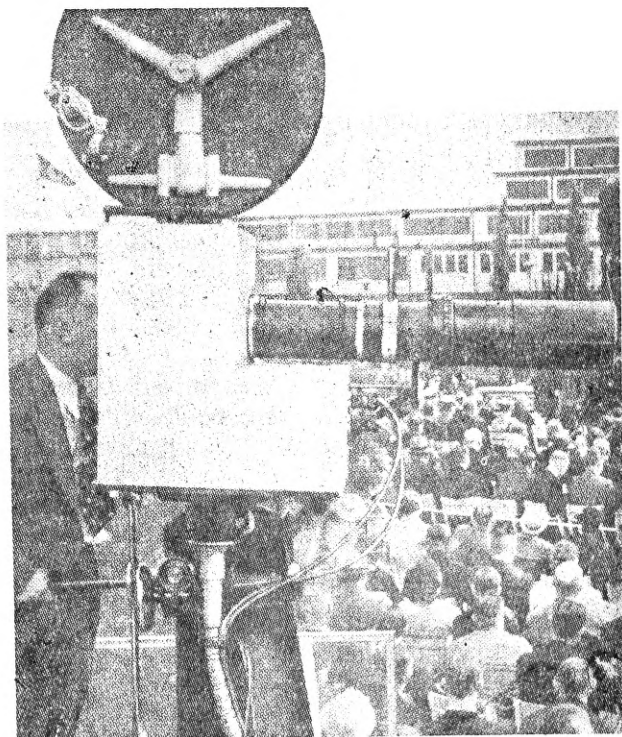
Berliini raadionäituse avamine anti edasi kaugenägemise abil

Seda aga ei saa öelda saateruumest. Need asuvad veel alles üürimajades ja on seetõttu varustatud kõigi kohandatud ruuumide puudustega. Võimendaja ruumide juures, ringhäälingu närviitsentrumis, on õieti ainult rida vähemaid saateruume — ikka kahes eksemplaris — flaami ja prantsuse saatekava jaoks. Erilised büroo- ja talitusruumid kumbagi kava jaoks, samuti redaktorite kabinetid jne. Ainult üksainuke suurem saatesaal on sealsamas, teised suuremad saatesaalid asuvad kõrvalmajades, nendest on üks endine kino ja teine endine kohviku saal. Sisseseaded on kõige hädapärasemad ja kõik kannab ajutise installatsiooni pitsatit. Tõeliselt ongi terve saateruumide organisatsioon ajutine ning hädapärane, sest vajadused on kasvanud kiiremini, kui võimalused. Kavatsusel oli, ja on praegu vist juba ka teoksil, uue erilise ja ees-