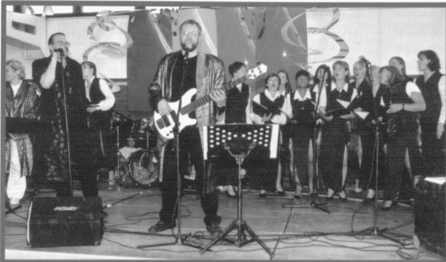
Meie Mees koos TTÜ naiskooriga küttis kuumaks piknikuliste meeled.