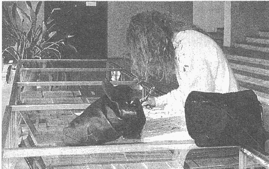
Istun kuhu tahes ja panen kuhu tahes.

Kuid pidage! Kodus me siiski oskame orienteeruda, mis millekski vajalik on. Näiteks ei kasuta me köögirätikut taskurätikuna. Samuti mitte kris-