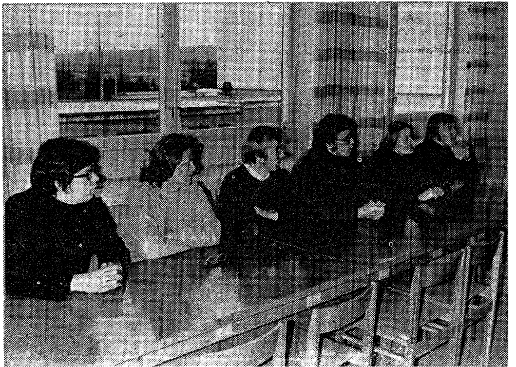
● Meie külalisteks olid Helsingi ülikooli sportlaste delegatsioon (pildil ülal) ja üliõpilasteater «Studio-4» Leningradist. Pikemalt lugege neist 3. leheküljel.