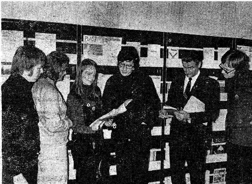
● Külalised tutvumas TPI raama tukoguga.