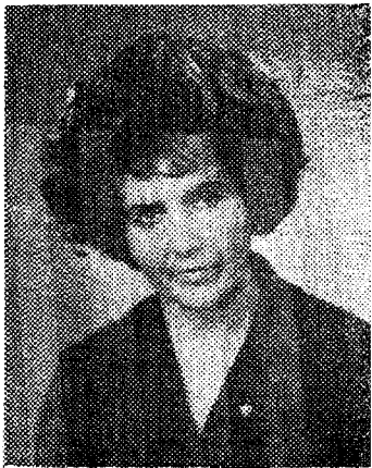
ENSV teeneline kunstitegelane

Paljud endised õpilased on saanud nüüd tema kolleegideks. Võõrkeelte ja vene keele kateedri töötajad soovivad juubilarile loomingulise sädeme jätku.