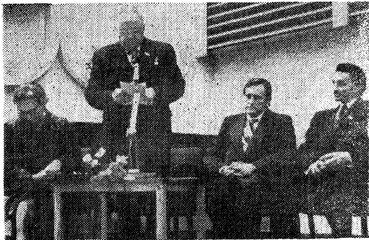
* Eesti NSV Ülemnõukogu Presiidiumi esimees sm. J. Käbin soovis meeskoorile veelgi kõlavamat lauluhäälet ja uusi loomingulisi võite.

Naiskoorile märkuseks — kõrge kunstimeisterlikkus on muidugi hea asi, mida hoida raske, kuid niisug-