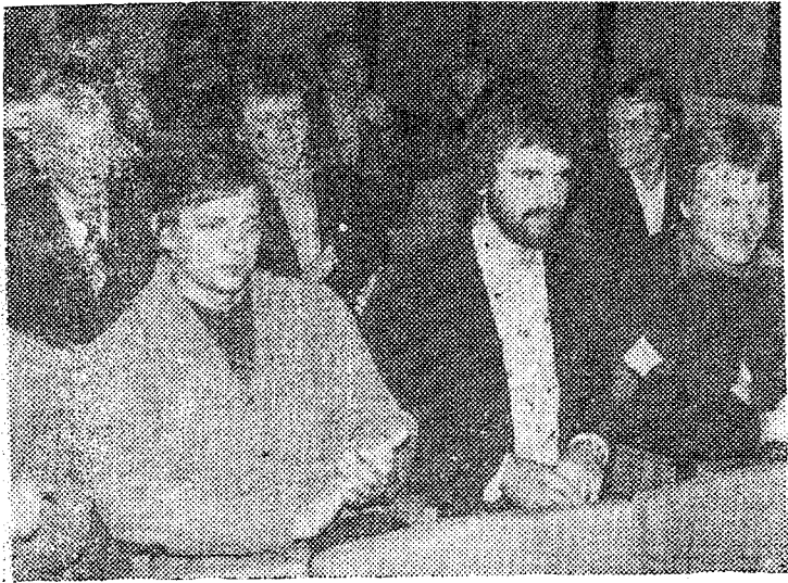
◆ Elektroautomaatikute konverentsil ...