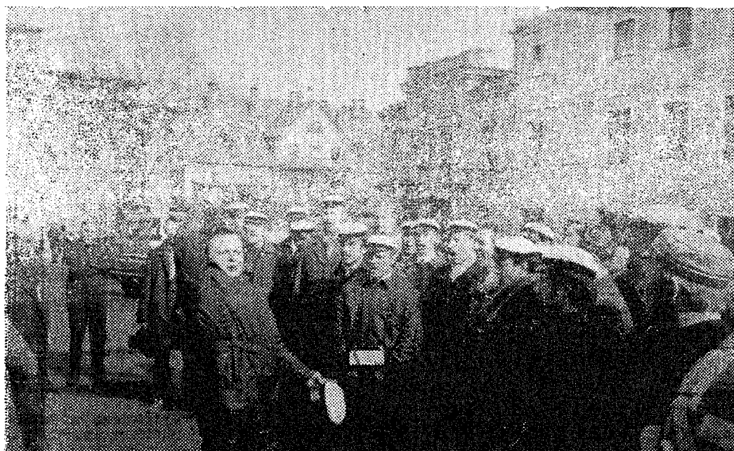
* Seekordne reis, meeskoori I autoralli, on toonud jälle Tartusse.

Intervjuu eest hoolitses TPI AM kroonik REIN LAUK