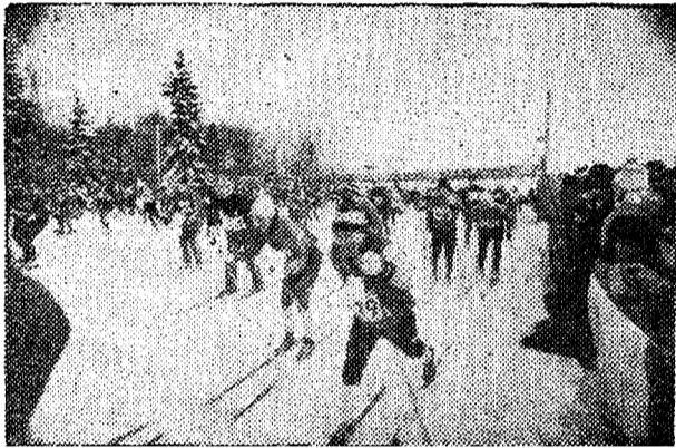
Maratonikaravan läks teele.