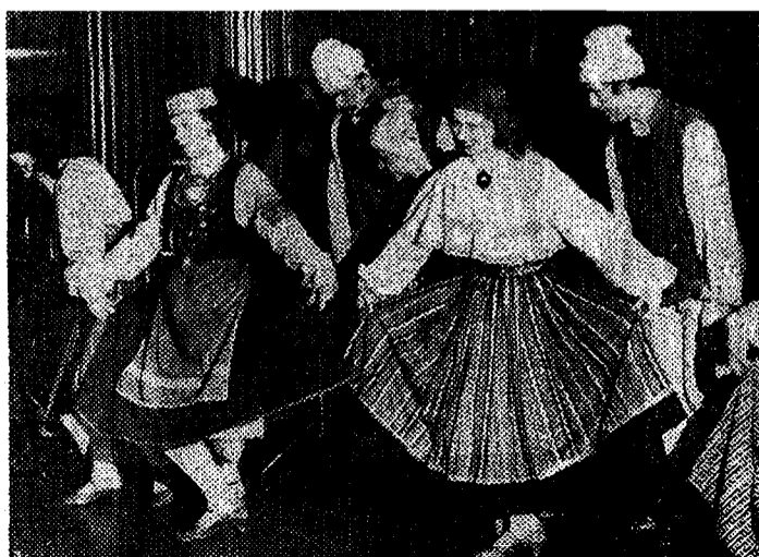
«Kuljus» õnnistab uue lava sisse

Uuest hoonest teeme edaspidigi juttu. Siis, kui tudengid oma esimesed söögiportsud kätte saanud (praegu ei taha köök veel korralikult töötada) ja kui teada, kuidas hakatakse õhtuid sisustama.