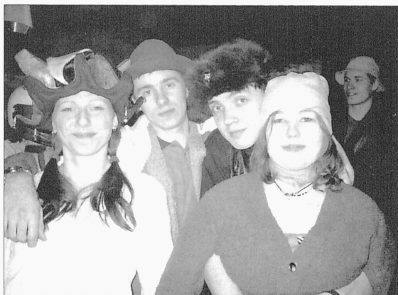
Meie oleme TTÜst.

järgi sarvede ja pika nokaga põdramüts. Napilt teiseks jäänud müts oli aga flaieritest ise tehtud – hästi tehtud. Järgnevalt astus publiku ette tudengibänd Pilvikud, mis mängis instrumentaalmuusikat. Väsimatud tantsisid veel poole ööni diskori muusika-valiku järgi.