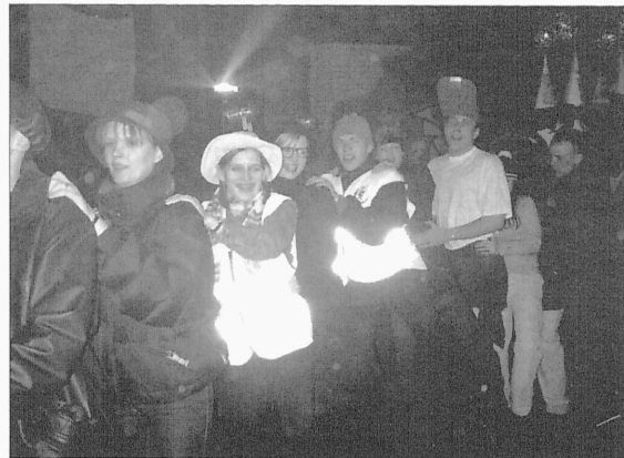
Tantsiti jenkat ja teisi lapsepõlvest tuntud tantse.

Rõõmsal meelel asuti võistluste juurde. Läbi meetrise kõrre tuli viie peale 3 õlut ära juua ja viimasesse pudelesse nuga sutsata. Õllesõbrad said ülesandega suurepäraselt hakkama ja õllega premeeritud. Plaadimuusikale vahelduseks esines Seits-