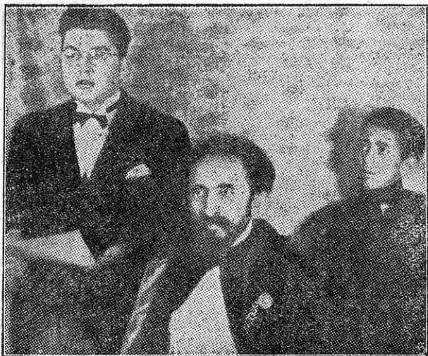
Abessiinia keiser kõneleb ringhäälingus Ameerikale. Seletusi annab ameerika ringhäälingu-reporter. Tagaplaanil prints Makonnen.