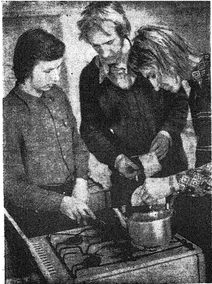
* Nii näeks välja vahet kõige «tipilikum» kõõgiseltskond (mitte toimkond!) ühes meie ühiselamuist. Head isu.