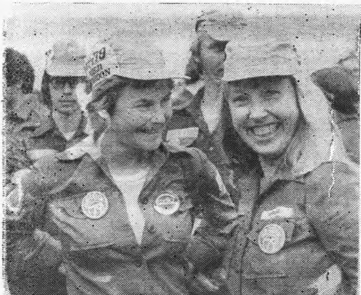
▲ Nii mindi avamiselt

Vist märkad isegi, et Sulle kui esmakursuslasele on viimasel ajal pööratud õige palju tähelepanu. Eks paista see käesolevast lehenumbriki. Ja eks ole kõikide heade soovide taga pisut manitsustki: et sissesäämisrõõmu sisse töötahe ja enesedistsipliin ära ei kaoks, et röömsale algusele immatrikuleerimisaktusel ei järgneks kunagi nii vastupidise sisuga ja kurba toimingut nagu eksmatrikuleerimine, s. t. üliõpilaste nimekirjast enneaegne kustutamine.