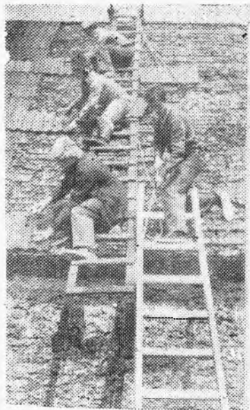
▲ Mitme mehe töö ja katus saab kähku korda