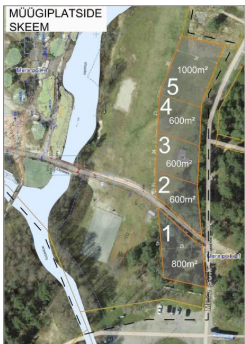
Joonis 5. Müügiplatside skeem