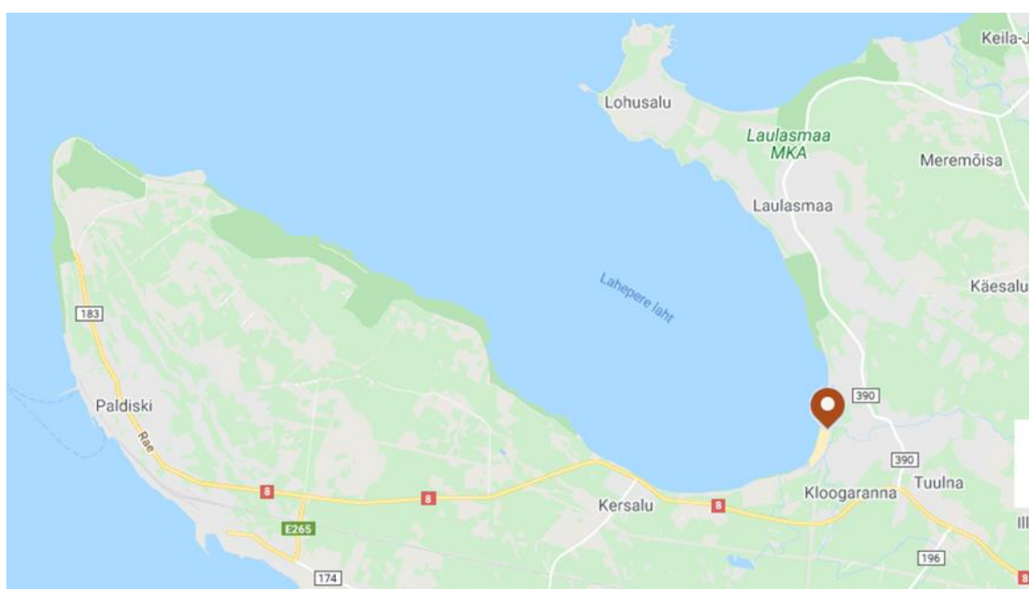
Joonis 1. Kloogaranna asukoht

Uuritav objekt Kloogarand asub Lahepere lahe kaldal, ühele poole jääb Pakri ja teisele poole Lohusalu poolsaar (vt Joonis 1). Kilomeetrite pikkune liivarand on maa poolt ääristatud männimetsaga (Puhka Eestis). Kloogarand asub Tallinnast ligikaudu 40 km kaugusel. Tallinnast on Kloogaranda võimalik sõita Keila-Paldiski ja Rannamõisa-Kloogaranna maanteed mööda. Lisaks sõidavad sinna Elroni elektrirongid ning Keila, Paldiski ja Tallinnaga ühenduvuses olevad maakonnaliini bussid. Mitmete matkaradade olemasolu annab võimaluse ligi pääseda ka jalgsi või rattaga sõites (Lääne-Harju Matkarajad).