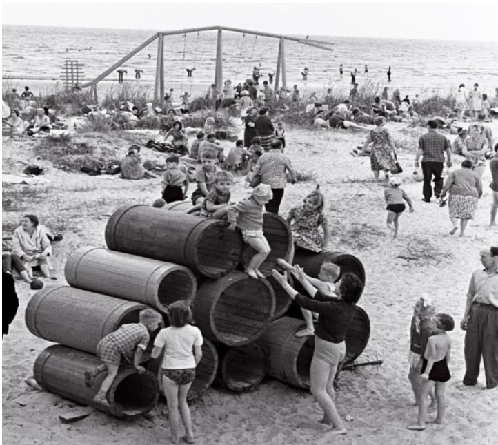
Joonis 2. Kloogaranna ranna-ala 1960.aastatel

1970-1980. aastatel oli Kloogarand Piritast populaarsem suvituspiirkond ja seda just oma puhtuse pärast. Suvekuudel oli ranna-ala tihedalt rahvast täis ja „valel“ ajal randa saabudes ei olnud võimalik enam liiva peal leida istumiskohta. Inimesed hindasid männimetsa lähedust ja sinna ümber loodud keskkonda. Tol ajal tegutsesid ranna-alal mitmed kioskid, kus müüdi kergemat kehakinnitust nagu jäätist, saiakesi ja karastusjooke. Kuna rand oli rahvast täis, siis kliente jagus iga leti äärde ja järjekorrad olid pikad. Täiskasvanutele olid eraldi rajatud õllemüügi kioskid, kust sai osta külma jooki. Lisaks asus ranna-alal restoran Kajakas, mis oli avatud teisipäevast pühapäevani. Päeval toimetas see söögikohana ja õhtul oli elava muusikaga restoran (Intervjuu kohalike elanikega).