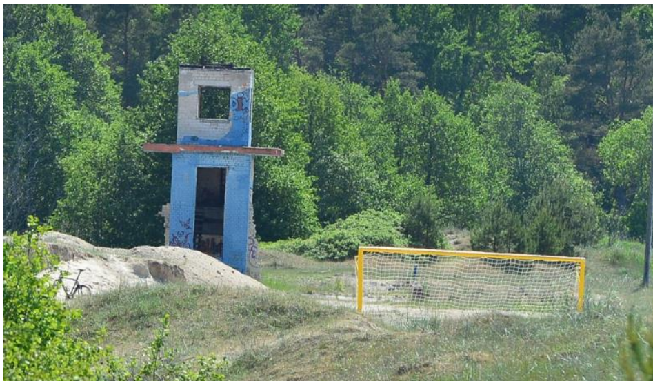
Joonis 3. Lagunema jäänud vetelpäästejaam Allikas: Andres Putting, 2013