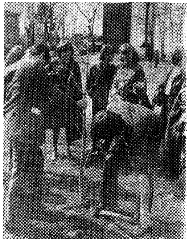
▲ Edasi mindi üksmeelselt istutama oma puud, sõbruspäev, sest nii tugev kui tammepuu...