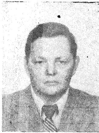
▲ Meie päevil elektrotehnika aluste kateedri õppejõud.

Eks ta oli hivalamine ka siis. Kui vorreida minu harjutusi tänaste ujujate treeningutega, siis oleksin treeningumahu suhtes umbes nii 7—8-aastaste laste tasemel. Ujumisega hakkasin tegelema «alles» 13-aastaselt, tänapäeval ei ole nii vanalt mõtet basseini minnagi, loetakse lootusetult hiilinenute kirja. Kahjul Üldiselt aga oli minu arvates sport tol ajal veidi populaarsem, eriti kooliõpilaste hulgas.