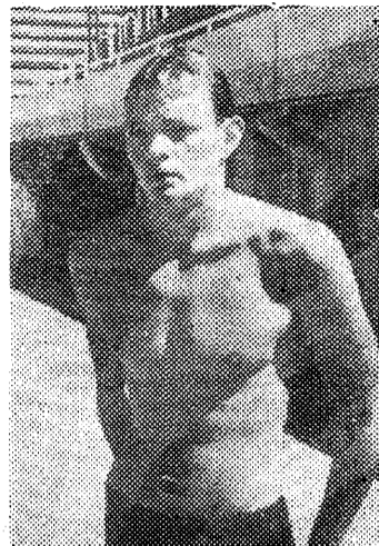
▲ Olümpialaagris Moskvast 1960. aastal.