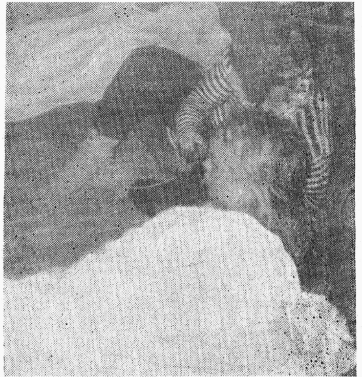
Ärkamine teispoosusel: millised on esimesed muljed?

Mis tulemas? Kõigepealt jällegi väiksemad torkimised. Üks neist ehitusteaduskonna peol, mis lehe ilmumiseks juba ajalugu. Inspiratsiooniks on 53