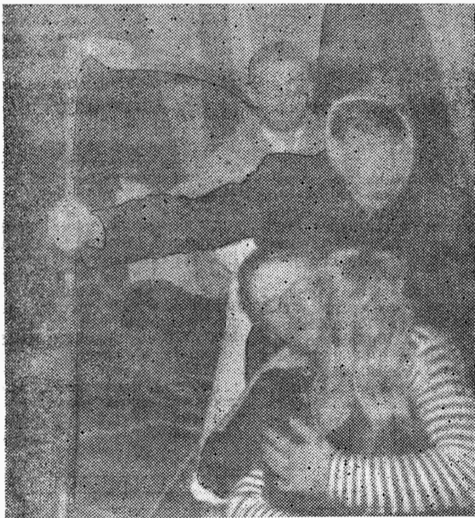
Surm ja Suur Silm avastavad, et Sina ja Mina on äkki teineteist armastama hakanud.

Käesoleva lehekülje iga sõna ja pildi autoriks olemise au kuulub «Plära Studio» eluröõmsale kollektiivile.