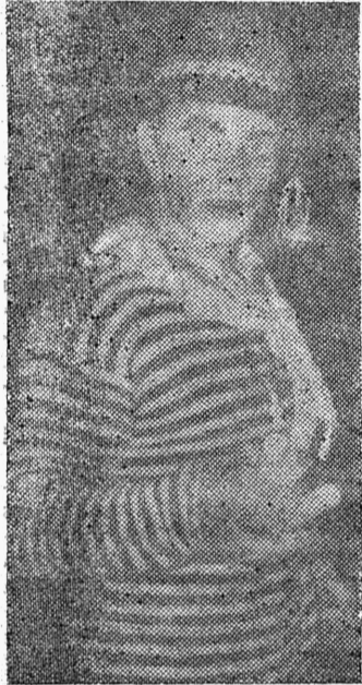
«Kes viib meilt valguse? Ehk mõni jäle narr?..»

Koos on nüüd käidud oma kaks kuud. Aega aadressaamiseks olnud piisavalt ja midagi olemas ka. Muistest kuulutusest «PLÄRA STUUDIO» formeerib tegevkoosseisu on saanud legend. Tegevkoosseis paigas — tahtmist ja väge täis.