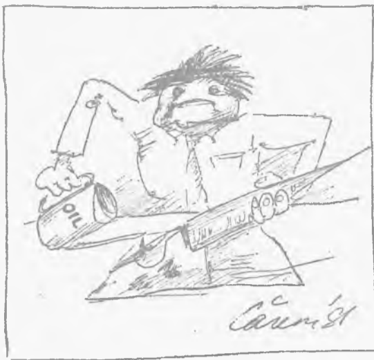
◆ Sulg ei libise millegipärast.