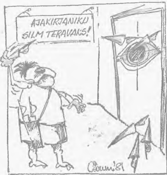
◆ Vahetunnil toimetuses.