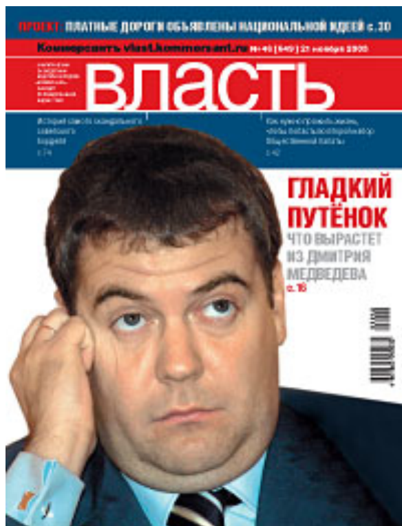
Приложение №.1 Журнал «Власть» №.46(649) от 21.11.2005 http://www.ljplus.ru/img4/a/t/atticus_pics5/vtju.jpg (19.05.2015)