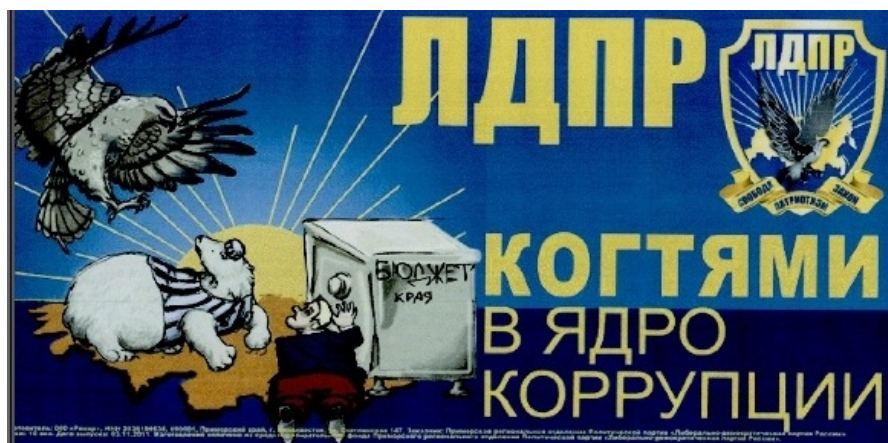
Приложение №.2 Плакат партии «ЛДПР» http://f.primamedia.ru/big/170/169494.jpg (19.05.2015)