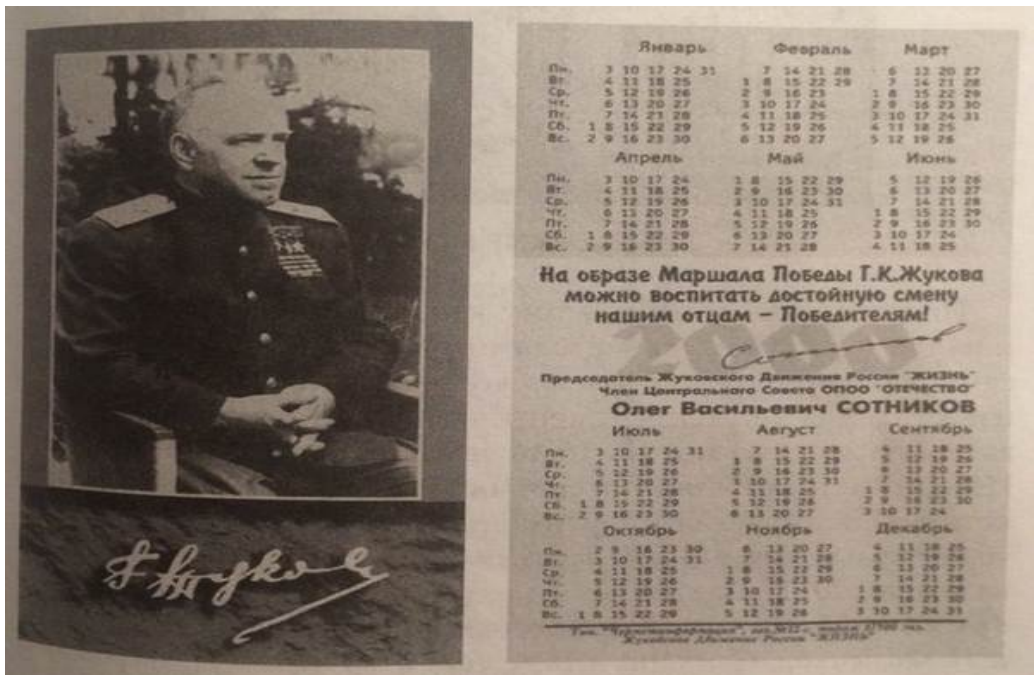
Приложение №.3 Предвыборный агитационный календарь (2000 год).

http://s020.radikal.ru/i707/1505/4f/ff71a5a29212.jpg (26.05.2015)