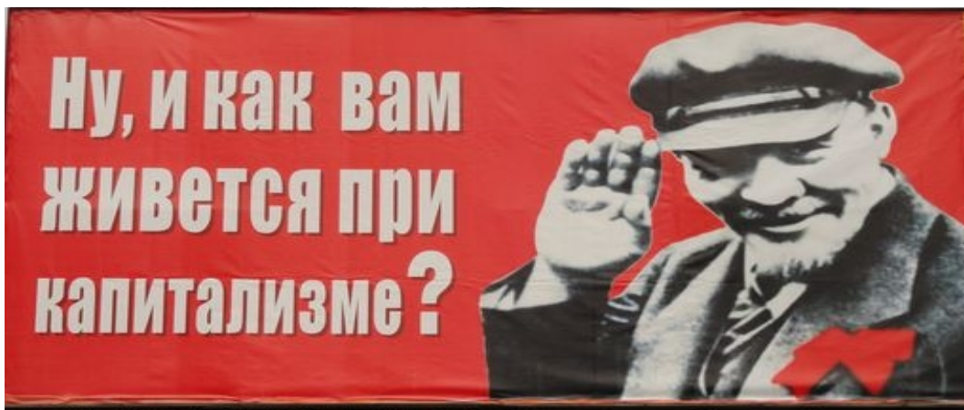
Приложение №.4 «Плакат КПРФ» (2011 год).

http://s020.radikal.ru/i707/1505/4f/ff71a5a29212.jpg (26.05.2015)