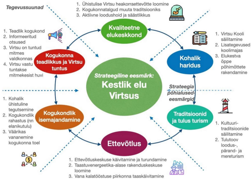
Joonis 1. Aruka Küla strateegia: Virtsu