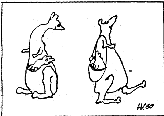
Mood nõuab muutusi!