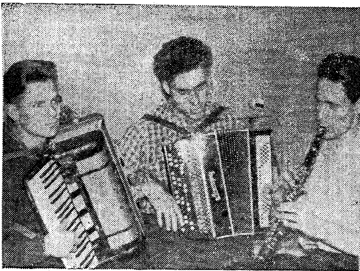
Kui eksam on sooritatud... Trio Rahvakohtu tänava ühiselamu toast nr. 9.