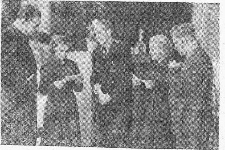
Делегаты конференции во время перерыва.