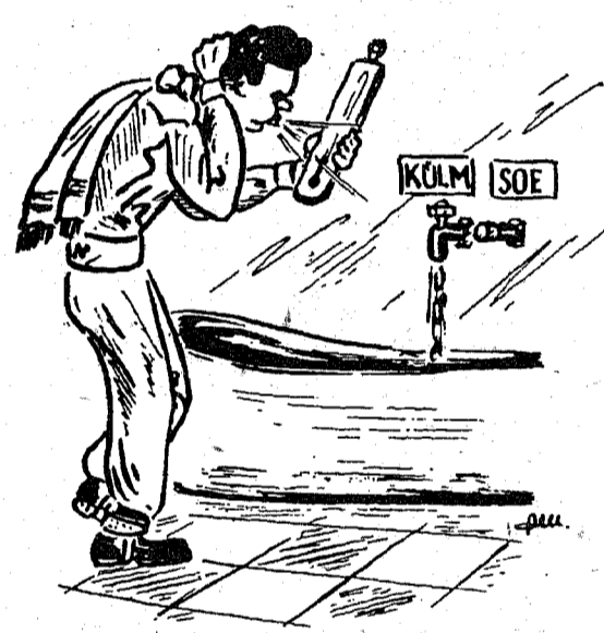
Kuid ühiselamus vaid ohka — ei pesta isegi saa pead.