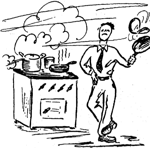
Gaas maja ühte poolde toodi siin kerge keeta suppi, teed.