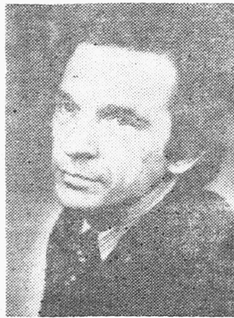
ÜLO LUHT — ENSV teene line kunstitegelane