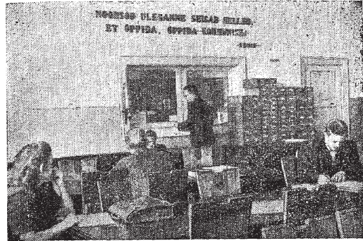
TPI raamatukogu lugemisaustas