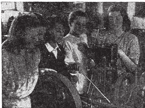
KÜLALISED LENINGRADIST. Leningradi ülikooli geograafia- fakulteedi üliõpilased tutvumas TPI soojusjõu-laboratooriumiga E. Viljaranna foto