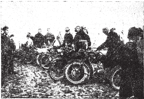
Leedu näikliste rivi TPI peahoone ees