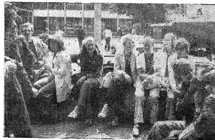
◆ Nüüd siis juba Poolamaal. Malevakaaslaste näod on küll samad, mis varemgi, kuid puhkeasend annab tunnistust meie sihst: võimalikult palju näha-kuulda, uut avastada - eks puhata jõuab koduski.