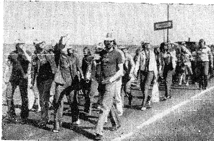
◆ Nii me läksimegi. Esialgu küll malevasuve pidulikule avamisele Maarjamäel.

võib veel tihti kuulda, küll auditooriumides, küll sööklas ja puhvetisabas. Ju siis on, mida meenutada ja teistelegi rääkida. Jutt jutuks, aga tõendiks vahvast malevasuvest on paljudel peale unustamatute mälestuste ka fotod ja diapositiivid. Täna lehe piltidele on jäänud üks möödunud suve välisrühmadest - Gliwice-76, kellest üksikasjalikumalt loete järgmises «Poli-tehnikus».