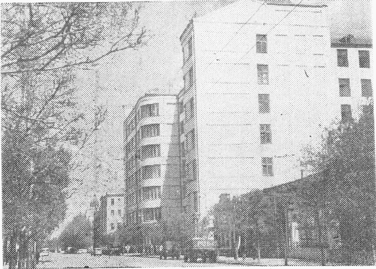
See on Kuibõšev.