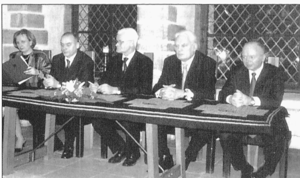
VILISTLASKAPITAL KASVAB: Arengufondi pidulikul vastuvõtul andsid neli tuntud ja edukat eestlast oma toetusallkirja.