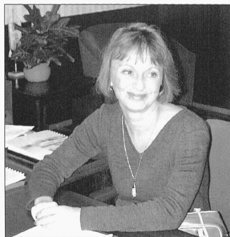
TERE TULEMAST ÜHENDRIIKIDESSE: USA ajutine asjur Dolores Brown julgustas jätkama õpinguid ookeani taga.