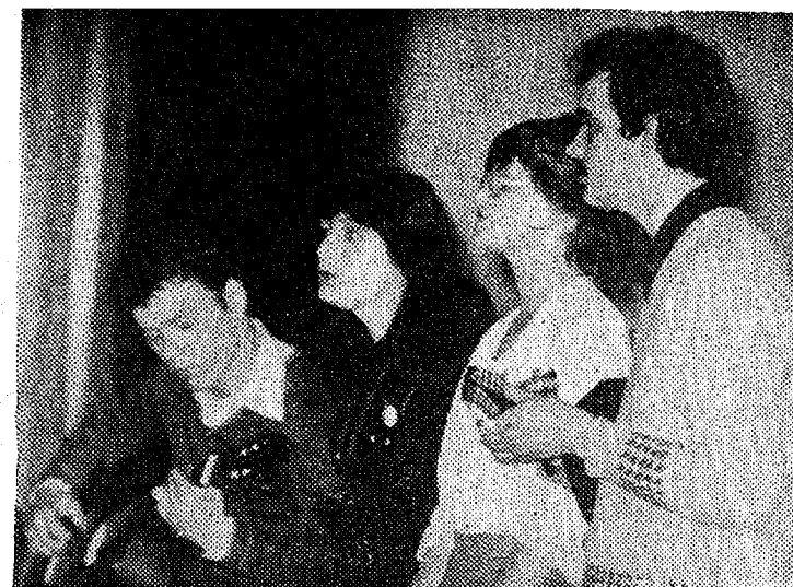
▲ Esineb TPedI folkansambel.