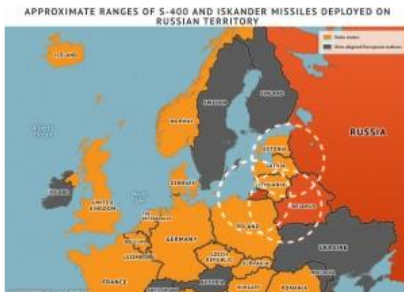
Joonis 3. S-400 ja Iskanderi laskekaugus Venemaa territooriumil (Neretnieks 2013)

Rootsis on juba pikka aega kritiseeritud olukorda, kus strateegilises asukohas olev saar on sisuliselt ilma sõjalise kaitseta, ning ekspertide poolt tehtud ohuhinnangutes on Vene sõjategevust Gotlandi saarel peetud üheks tõenäoliseks ohuks. Rootsi kaitseuurijad rõhutasid, et Balti riikides on suured venelastest vähemuste kogukonnad, mille kaitsmist ettekäändena tuues võiks Venemaa Rootsit ja Gotlandi saart rünnata. Venemaa jaoks on Gotlandi tähtsus veelgi kasvanud seoses Nord Streami kulgemisega selle esisel. Läänemere suurim saar Gotland asub Rootsi idaranniku lähedal, keset Läänemerd, 130 kilomeetrit Lätist, 90 kilomeetrit Rootsi rannikust. (Viirand 2015)