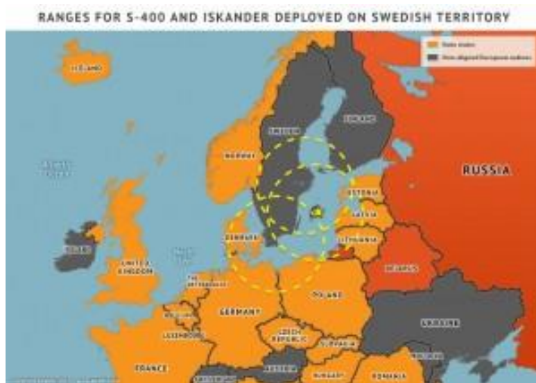
Joonis 4. S-400 ja Iskanderi laskekaugus Rootsi territooriumil (Neretnieks 2013)

USA-s ilmuv väljaanne World Affairs kirjutab, et Okupeerides Gotlandi, isegi ajutiselt, suudaks Venemaa edukalt nurjata igasugused NATO vägede saatmised Balti riikidesse, lõigata läbi ka võimalikud õhusillad läänest siinsesse regiooni ja peatada ka võimalused Venemaa allveelaevade ja lennukite tegevuse takistamiseks. Rootslased rõhutasid, et juba iidsetel aegadel teati, et kes on Gotlandi isand, see valitseb ka Läänemerd.