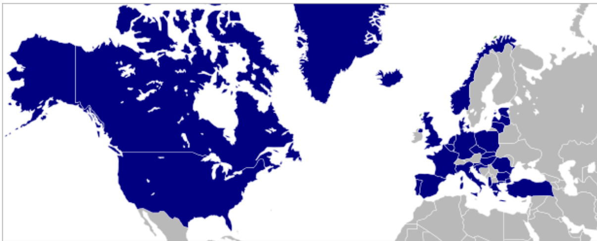
Joonis 2. NATO liikmesriigid (NATO 2015)

Enne Saksamaa taasühinemist, polnud Rootsil mingit otsekontakti NATO-ga. Nende neutraliteedipoliitika oli selle välistanud. Nüüd aga joonistati ümber kogu Euroopa geopoliitiline kaart, mis andis võimaluse Rootsi ja NATO suhete paranemiseks.