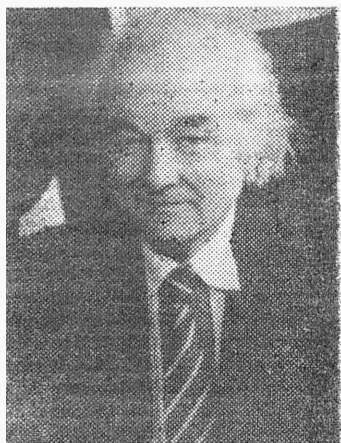
Lp. KOLLEEGID JA KÜLALISED

TPI ÕPETATUD NÕUKO- GU PIDULIKUL LAHTI- SEL ISTUNGIL.