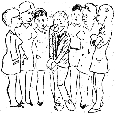
Tere, ma olen teie uus insener!