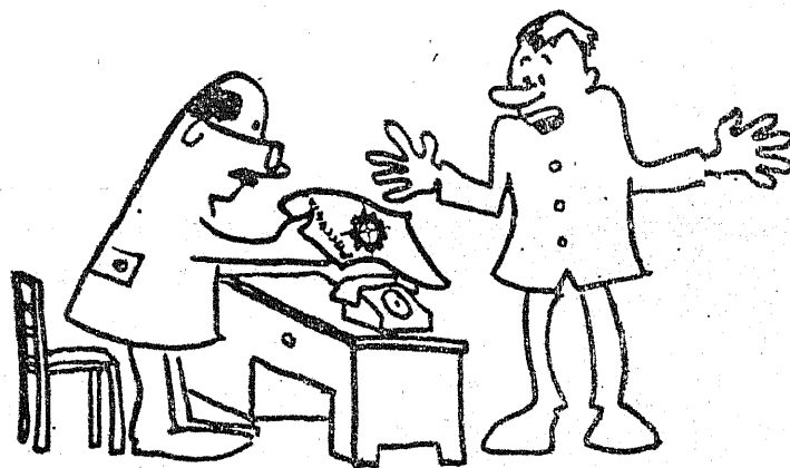
Seda pole meile õpetatud!