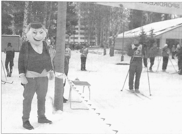
Tudengkonna maskott Julius tervitab rajale minejaid.