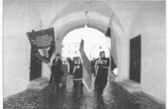
Tipikad käisid traditsiooniliselt Toompeal tervitamas oma riiki tema sünnipeval.