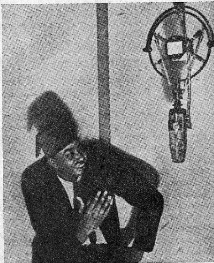
Sudaani laulja Egiptuse ringhäälingus