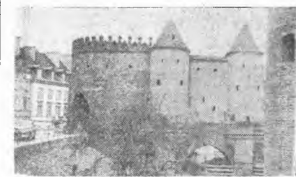
Pilte ehitusmalevlaste reisilt Poola. «Siren» Varssavi vanalinn. Endise Oswiecemi laagri sissekäik. Restaureeritud vanalinna fragment.