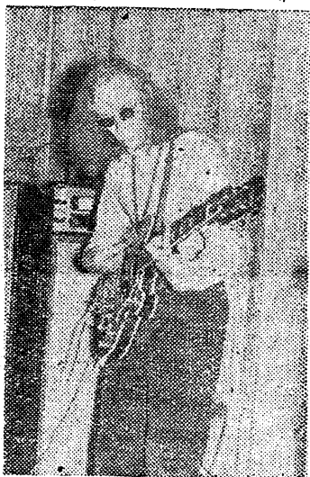
noorte talentide väljakasvatamist ja sellega teha oma panus üliõpilaskonna esteetilisse kasvatusse.