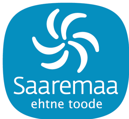
Joonis3: Märgis Saaremaa Ehtne toode